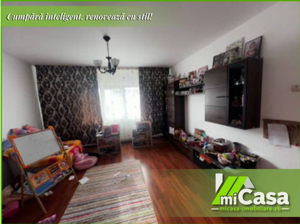
Cumpără inteligent, renovează cu stil!